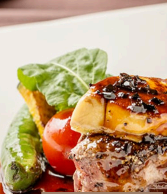
オーベルジュ料理 欧風 or 会席 or 和洋