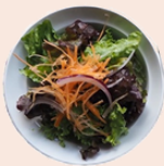
ミニサラダ (税込275円)