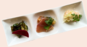
前菜3種盛り (税込440円)