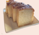
フォカッチャ1つ (税込88円)