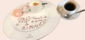
デザートセット (税込880円)