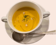
本日のスープ (税込495円)